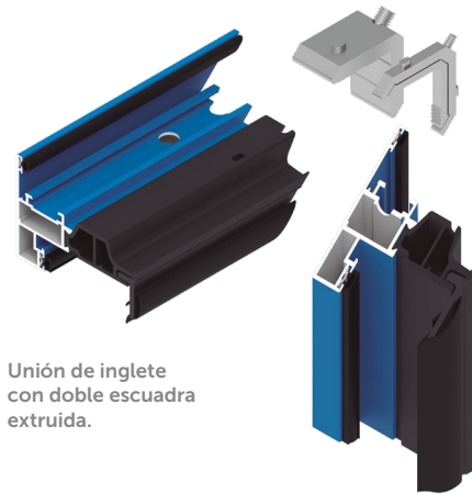
Unión de inglete con doble escuadra extruida.