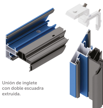
Unión de inglete con doble escuadra extruida.