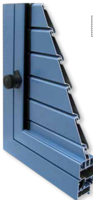
Aperturas Mallorca C.E.